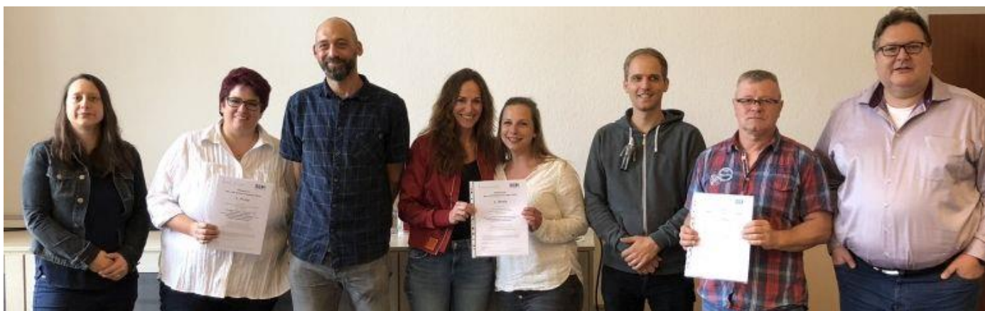
Gruppenbild aller Preisträger*innen

mit Kolleg*innen diskutiert. Die folgenden Projekte wurden eingereicht und prämiert: